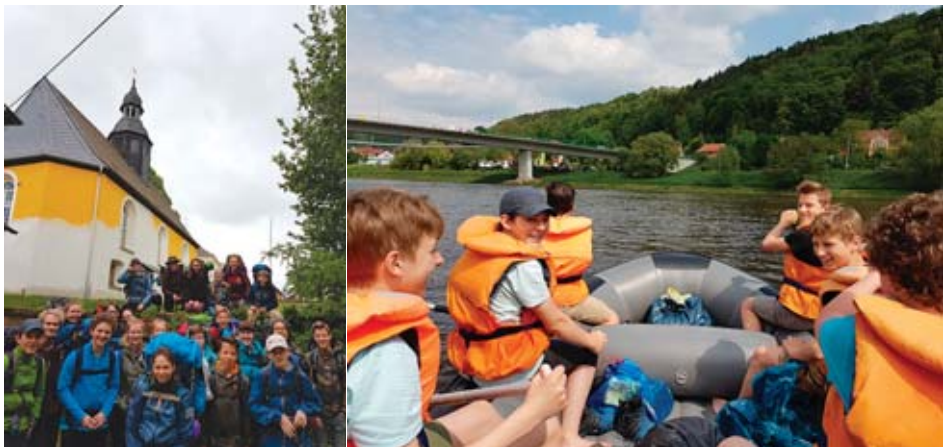
Abenteuertage der Jungen Gemeinde 2017