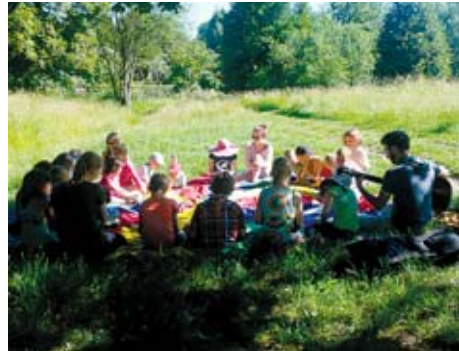
Gottesdienst im Heiligen Born