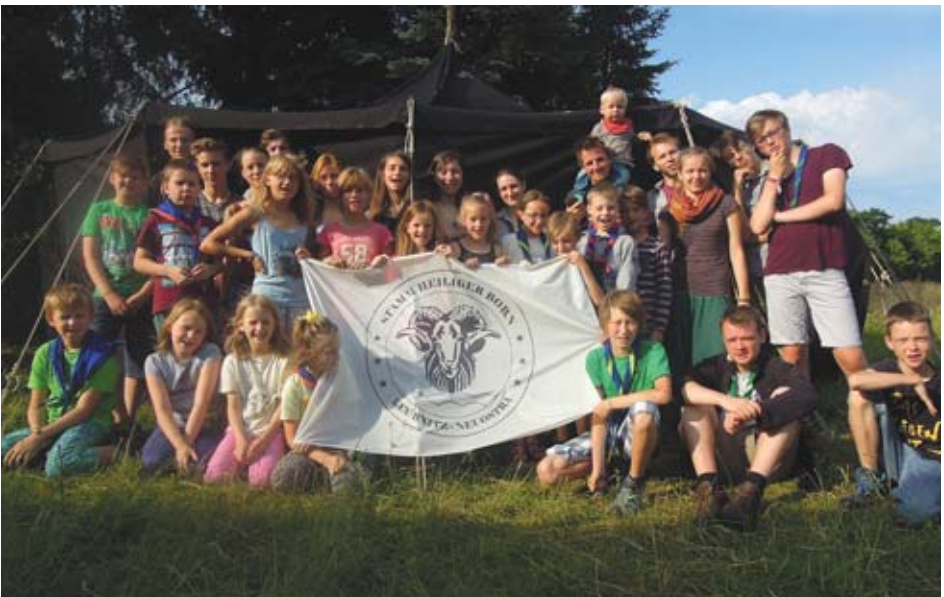
...unsere Pfadfinder vom „Heiligen Born“ zur Lagerfahrt in Eichholz