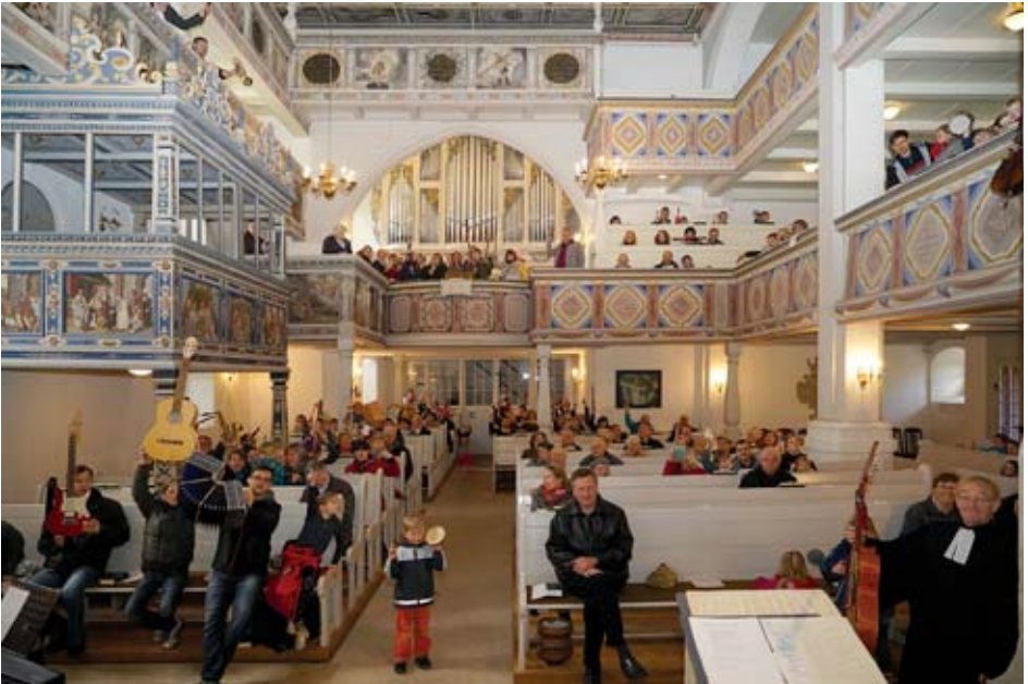
Kantate - Familiengottesdienst ...unsere Gemeinde als Festorchester