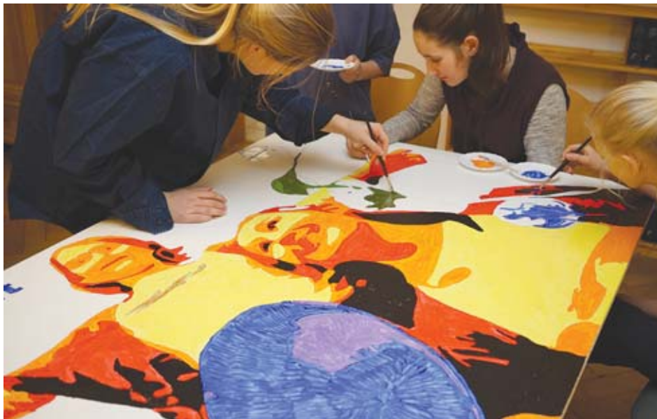
Entstehung des Tafelbildes an der Wilhelm-Franke-Straße