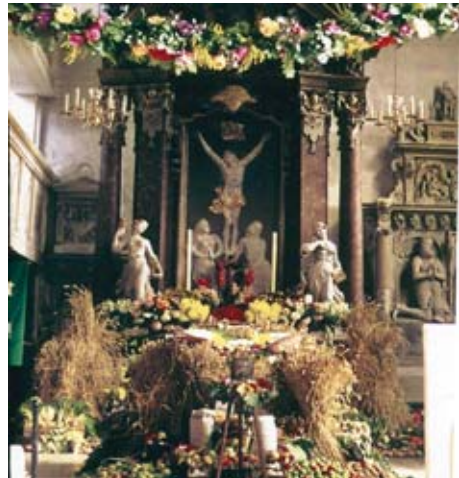
Erntedankfest 1956

Annahme der Erntegaben am Sonnabend, 26.9., 14–18 Uhr in der Kirche bzw. jeweils vor dem Gottesdienst