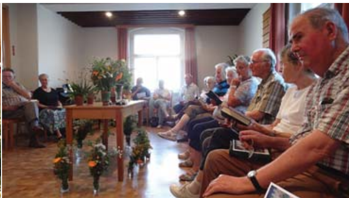
„Lilie, Rose, Gänseblümchen“ Sommerlicher Gemeinabend in Kaitz - 2015