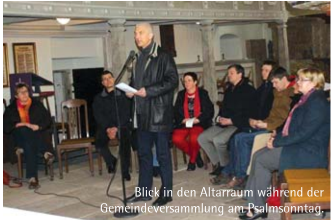
Blick in den Altarraum während der Gemeindeversammlung am Psalmsonntag.