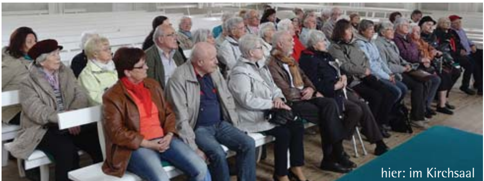
hier: im Kirchsaal