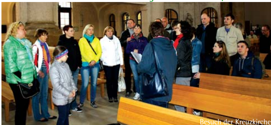
Besuch der Kreuzkirche