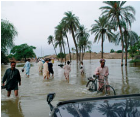
Pakistan nach der Flut