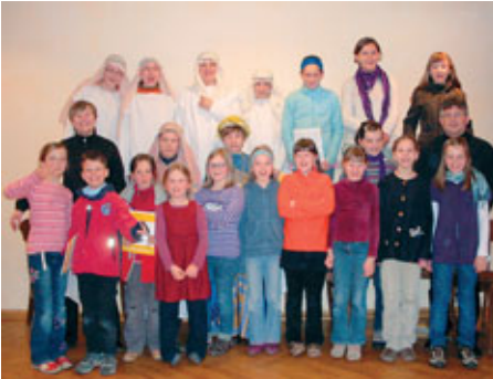
Gruppenfoto vor der Aufführung in Leubnitz

„Philippus und der Kämmerer“ mit den Kurrenden Leubnitz und Meißen