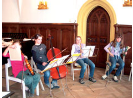
„Orchesterprobe“ für das Musical in Meißen