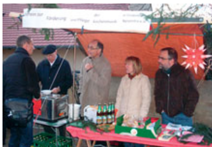
3) 1. Advent: Stand auf der Menzelgasse beim Pyramideanschieben