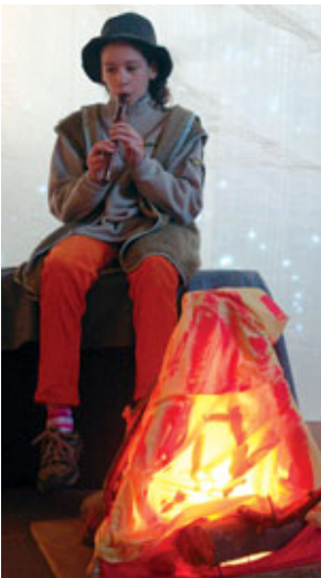
Kurrenden und Jugendchor am Heiligabend