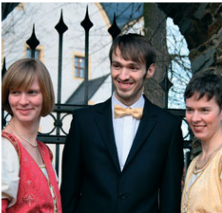
das Leipziger „ensemble singklang“

Die drei Teilnehmer des 3. Internationalen A CAPELLA Wettbewerbs Leipzig hatten im Herbst 2008 ihr Konzertdebüt im Christophorussaal gegeben und wurden dank der durchweg positiven Resonanz auf den Fuß wieder nach Dresden eingeladen.