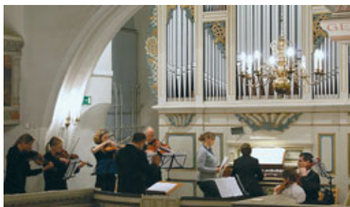
1) 5. Orgelwoche 2009: Konzert mit Musikern zumeist aus unserer Gemeinde