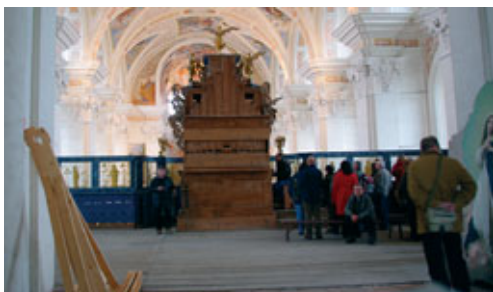
2) Orgelfahrt 2009: Kloster Krzeszow (Grüssau) in Schlesien/Polen