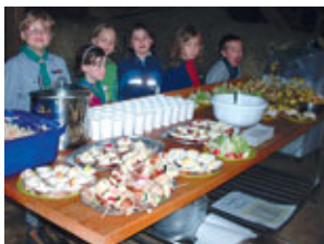
... unser Dschungelfest

Bei der Lagerfahrt nahmen Kinder aus den Meuten „Kreuzspinnen“ (Bannewitz), „Wanderfalken“ (Leubnitz) und dem Stamm „Regenbogen“ (Strehlen) teil. Dank an alle Leitwölfe und Gott für seine herrliche Natur.