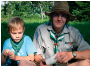
... Zeit miteinander