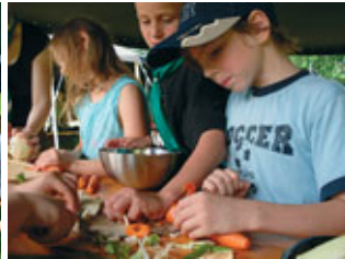
... Essen selbst kochen