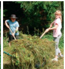
... Hilfeinsatz in der Körnungsmühle