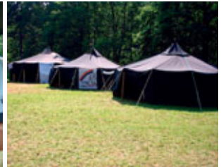
... in Jurten dem Regen trotzen