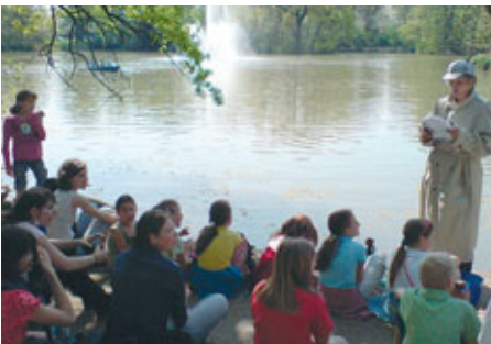
...ein schwieriger Fall im Großen Garten