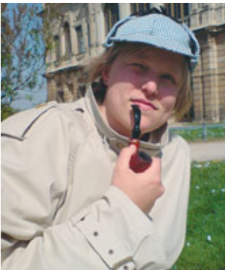
...mit Sherlock Holmes