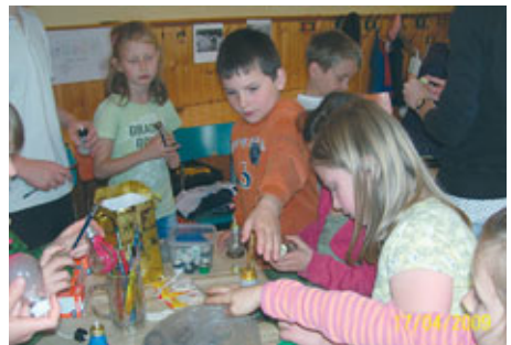
...und vielen anderen Aktionen