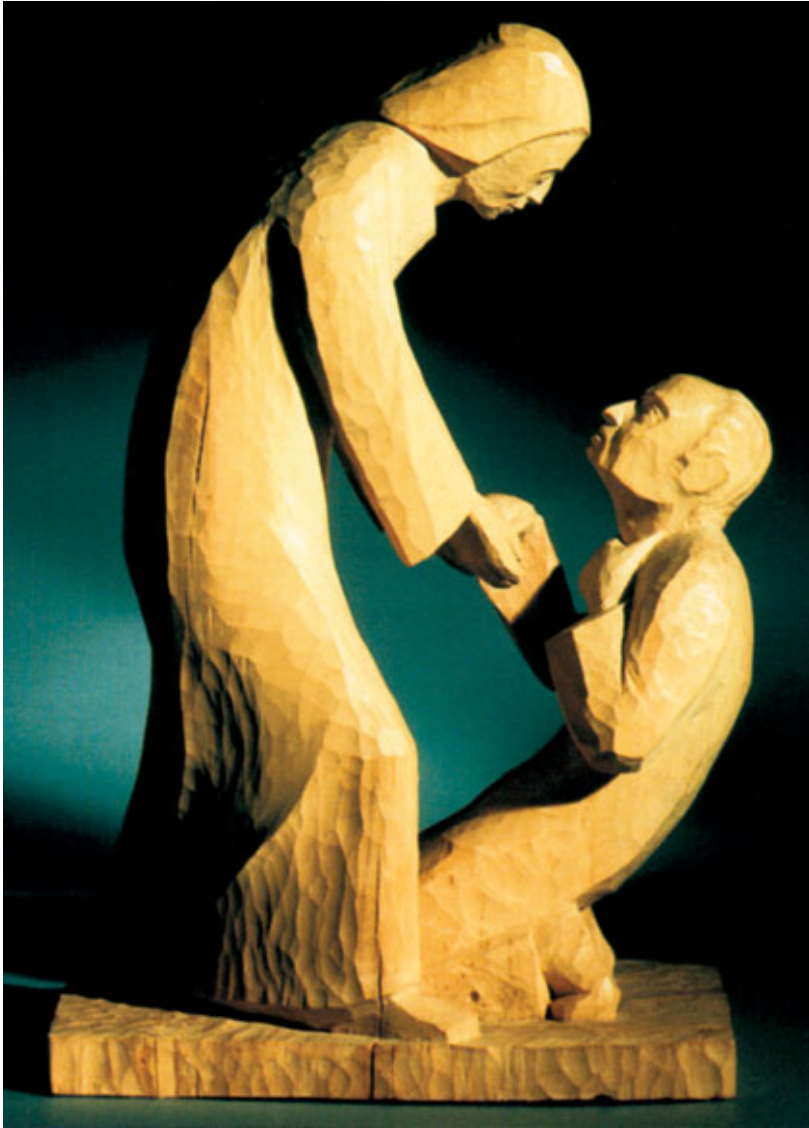
Der ungläubige Thomas