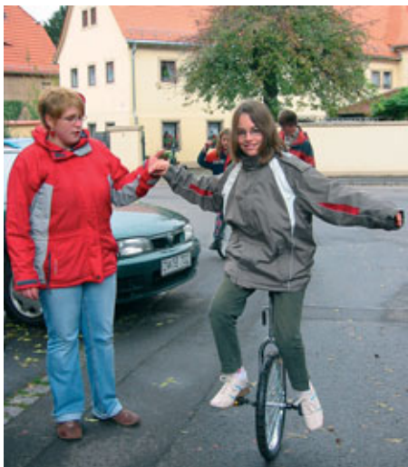
Offener Treff „Ich dreh am Rad“..