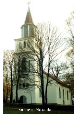
Kirche in Skrunda