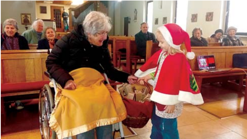
Gottesdienst im kath. Pflegeheim Goppeln